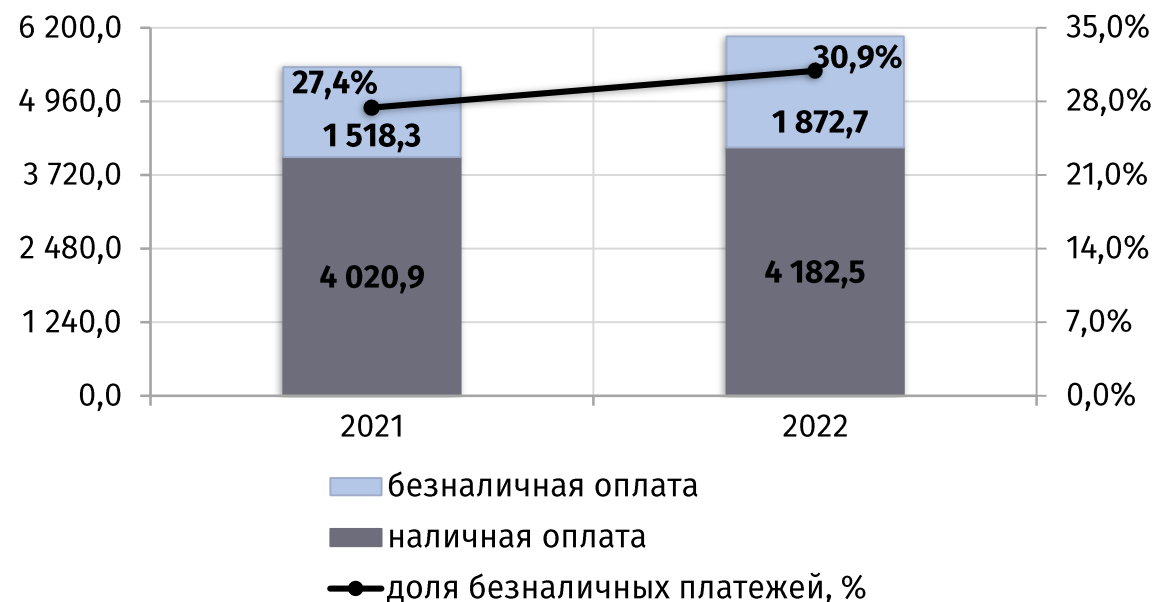
динамика потребительского рынка в январе-июне 2 (в текущих ценах, млн руб.)