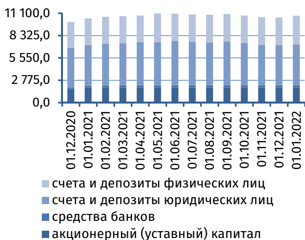
Рис. 1. Динамика основных видов пассивов, млн руб.

Совокупный объём средств клиентов 1 банков на срочных депозитах и депозитах до востребования расширился на 222,6 млн руб. (+2,7%), составив 8 610,5 млн руб. Ключевым фактором данной динамики выступил активный рост величины онкольных обязательств – на 303,0 млн руб. (+7,3%), до 4 453,6 млн руб., тогда как срочная депозитная база сократилась на 80,4 млн руб. (-1,9%), до 4 156,9 млн руб. (рис. 2).