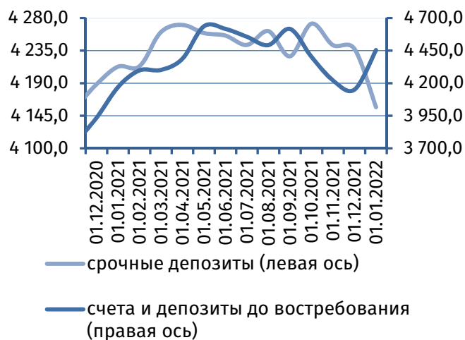
Рис. 2. Динамика депозитной базы, млн руб.

Основу динамики привлечённых ресурсов сформировал приток средств физических лиц на сумму 167,6 млн руб. (+4,9%), до 3 572,0 млн руб., вследствие пополнения депозитов до востребования на 160,3 млн руб. (+13,2%), до 1 373,6 млн руб., большей частью обусловленного зачислением социальных трансфертов на счета получателей пенсий. Пополнение срочных вкладов было более умеренным – на 7,3 млн руб. (+0,3%), до 2 198,4 млн руб.