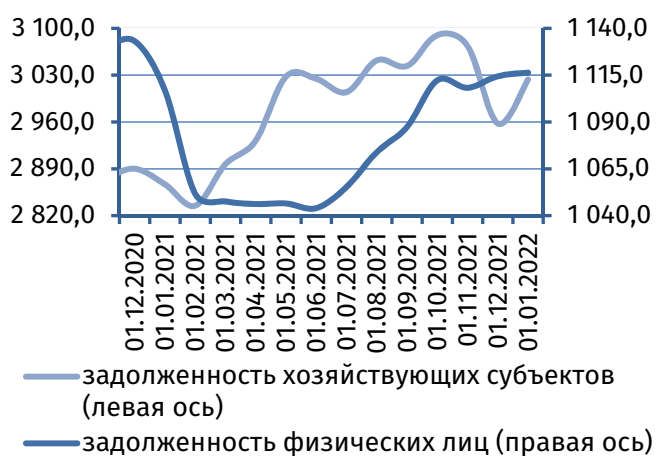
Рис. 4. Динамика задолженности по кредитам, 2 млн руб.

Совокупный кредитный портфель коммерческих банков за отчётный месяц незначительно расширился – на 0,3%. Основным фактором, поддерживающим данную динамику в области положительных значений, выступил рост задолженности по кредитам 2 субъектов реального сектора экономики, в результате чего остаток обязательств корпоративных клиентов увеличился на 65,8 млн руб. (+2,2%), до 3 023,4 млн руб. (рис. 4). Ростом характеризовалось и потребительское кредитование – на 1,9 млн руб. (+0,2%), остаток задолженности физических лиц на 1 января 2022 года составил 1 116,3 млн руб. Объём межбанковского кредитования уменьшился на 34,4 млн руб. (-19,0%), до 146,5 млн руб.