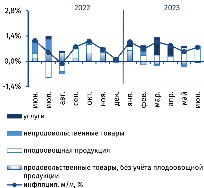
Рис. 3. Вклад основных компонент в сводный индекс потребительских цен, п.п.

В России и Молдове товары данной группы подорожали в среднем на 0,4% м/м и 0,2% м/м соответственно, в Беларуси – сохранились на уровне предыдущего месяца. В Украине, напротив, большинство ключевых позиций сегмента дешевели.