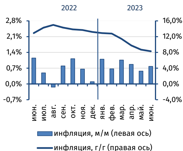
Рис. 1. Динамика СИПЦ в 2022-2023 гг.

Понижательный тренд прослеживается в изменениях сводного индекса потребительских цен (СИПЦ) в годовом выражении: в июне он снизился ещё на 0,4 п.п., до 8,3% г/г (12,9% г/г годом ранее, табл. 1).