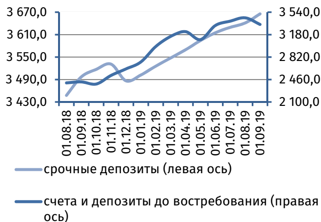
Рис. 2. Динамика депозитной базы, млн руб.

Совокупная величина клиентской базы 2 снизилась на 82,1 млн руб. (-1,2%), составив 7 009,8 млн руб. Основным фактором выступило сокращение онкольных обязательств на 106,4 млн руб. (-3,1%), до 3 344,2 млн руб., тогда как срочная депозитная база расширилась на 24,3 млн руб. (+0,7%), до 3 665,6 млн руб. (рис. 2).