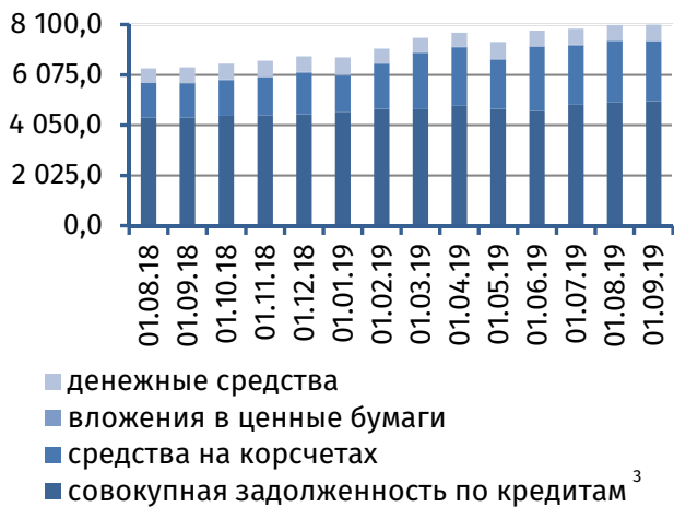
Рис. 3. Динамика основных видов активов, млн руб.