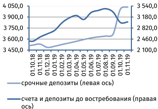
Рис. 2. Динамика депозитной базы, млн руб.

Совокупная величина клиентской базы 2 возросла на 46,5 млн руб. (+0,7%), составив 7 054,8 млн руб. В её структуре срочные депозиты увеличились на 30,5 млн руб. (+0,8%), до 4 036,7 млн руб., онкольные обязательства – на 16,0 млн руб. (+0,5%), до 3 018,1 млн руб. (рис. 2).