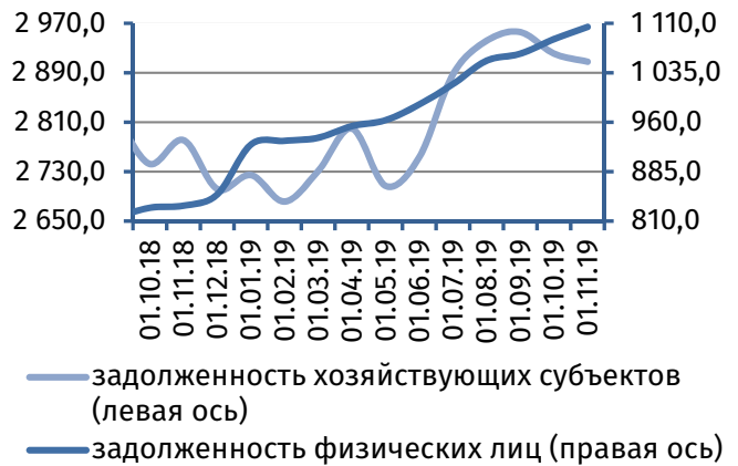
Рис. 4. Динамика задолженности по кредитам, 4 млн руб.

Результаты деятельности коммерческих банков республики в октябре 2019 года характеризовались формированием чистой прибыли на уровне 24,3 млн руб. (в сентябре – 13,5 млн руб.).