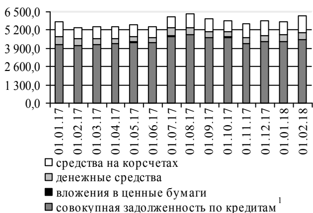
Рис. 3. Динамика основных видов активов, млн руб.

Срочная депозитная база также демонстрировала повышательную динамику (+146,5 млн руб. до 3 746,6 млн руб.) вследствие роста остатков на счетах как корпоративных клиентов (+60,2 млн руб.), так и физических лиц (+86,4 млн руб.). Величина привлеченных на межбанковском рынке срочных депозитов не изменилась (рис. 2).