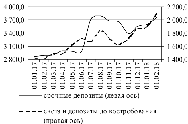
Рис. 2. Динамика депозитной базы, млн руб.

Срочная депозитная база также демонстрировала повышательную динамику (+146,5 млн руб. до 3 746,6 млн руб.) вследствие роста остатков на счетах как корпоративных клиентов (+60,2 млн руб.), так и физических лиц (+86,4 млн руб.). Величина привлеченных на межбанковском рынке срочных депозитов не изменилась (рис. 2).