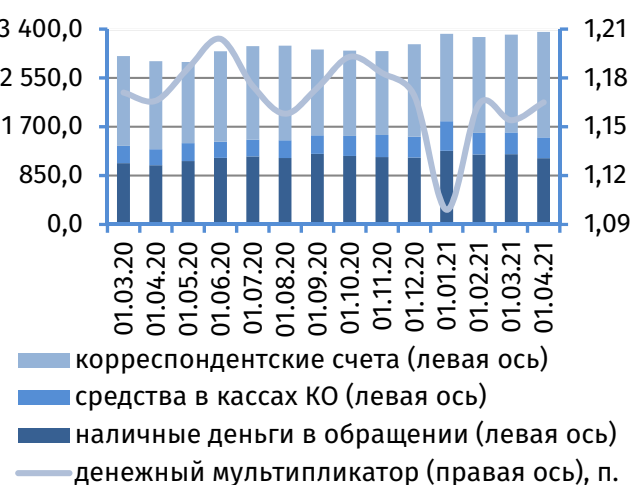
Рис. 2. Динамика денежной базы, млн руб.

Размер денежной базы возрос на 47,3 млн руб. (+1,4%), сложившись на 1 апреля 2021 года на уровне 3 361,4 млн руб. (рис. 2), что обеспечено ростом остатков средств на корреспондентских счетах кредитных организаций в Приднестровском республиканском банке на 133,5 млн руб. (+7,9%), до 1 833,3 млн руб. Величина обязательств центрального банка по выпущенным наличным денежным средствам (включая остатки в кассах кредитных организаций) уменьшилась на 86,2 млн руб. (-5,4%), до 1 515,6 млн руб.