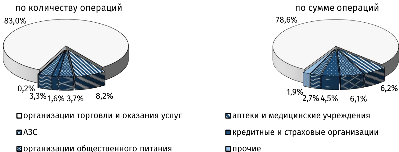
Рис. 2. Структура безналичных операций в пунктах размещения платёжного оборудования в августе 2021 года, %

Объём денежных средств, переведённых физическими лицами с карты на карту, увеличился на 8,7%, до 53,3 млн руб. (5,5% в совокупном показателе). При этом средний размер одного денежного перевода составил 609,9 руб. против 591,1 руб. месяцем ранее.