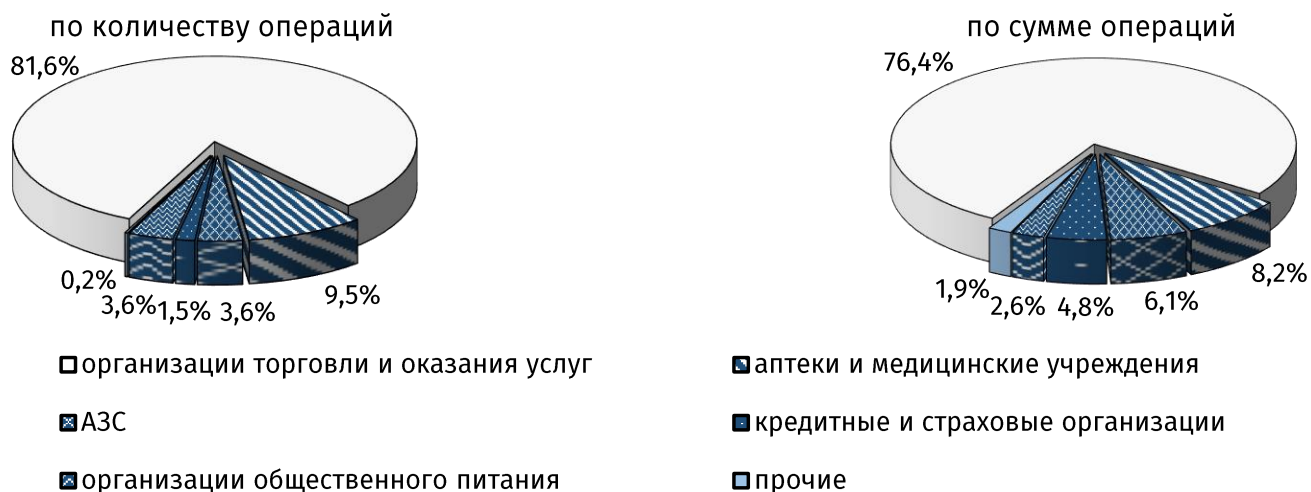
Рис. 2. Структура безналичных операций в пунктах размещения платёжного оборудования в октябре 2021 года, %

Объём денежных средств, переведённых физическими лицами с карты на карту, увеличился за месяц на 21,2%, до 72,2 млн руб. (6,9% в совокупном показателе). Средний размер одного денежного перевода составил 625,2 руб. против 606,3 руб. в сентябре 2021 года.