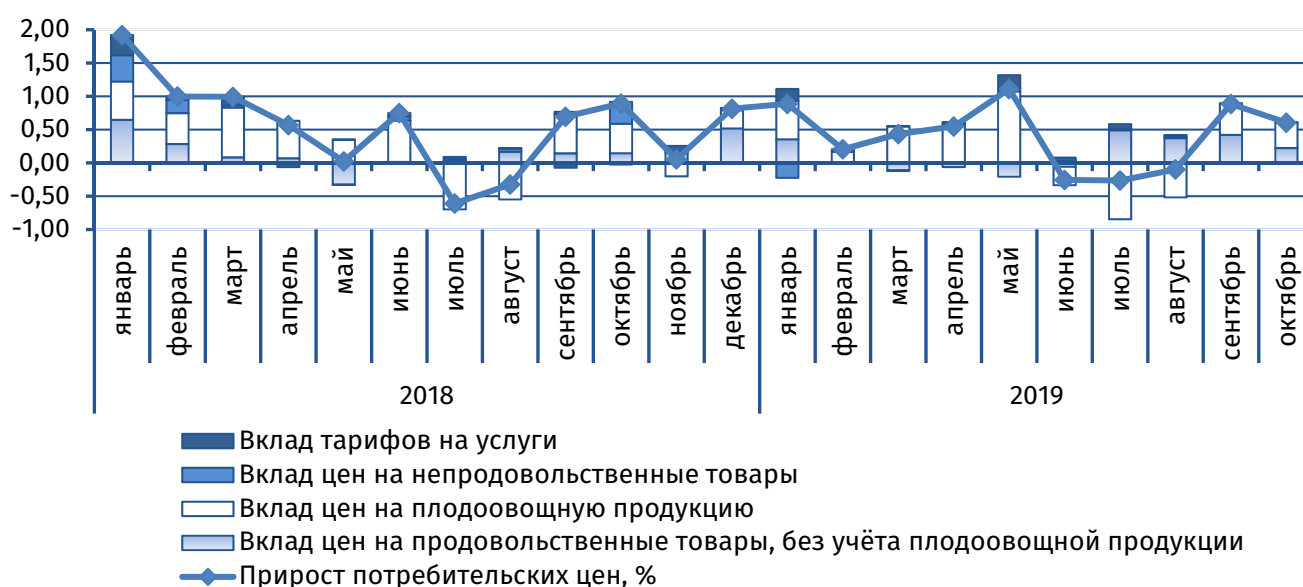
Рис. 1. Вклад основных компонент в сводный индекс потребительских цен, п.п.

В октябре стоимость стандартного набора товаров и услуг на приднестровском рынке возросла на 0,6%, что на 0,3 п.п. ниже параметров соответствующего месяца 2018 года. Основное проинфляционное влияние генерировалось со стороны продовольственного сегмента: индекс по группе составил 101,5%. В наибольшей степени, ввиду сезонного воздействия, подорожала плодоовощная продукция – +5,2%, её вклад в совокупный прирост цен традиционно является определяющим (0,4 п.п., рис. 1). Наибольший ценовой рост, как и на рынках стран-партнёров, был зафиксирован по овощам (+13,4%). Значительно повысилась стоимость кабачков (+50,0%), сладкого перца (+36,2%), баклажанов (+33,8%), огурцов (+29,0%) и томатов (+16,6%). В то же время на фоне расширения предложения снизились цены на тыкву (-11,5%), капусту (-10,5%), лук (-1,2%), морковь (-0,9%) и свёклу (-0,1%). Стоимость картофеля возросла на 1,6%, что ниже темпов удорожания, наблюдаемых в соседней Молдове, где ввиду сокращения внутреннего предложения и увеличения закупочных цен картофель подорожал на 17,3%.