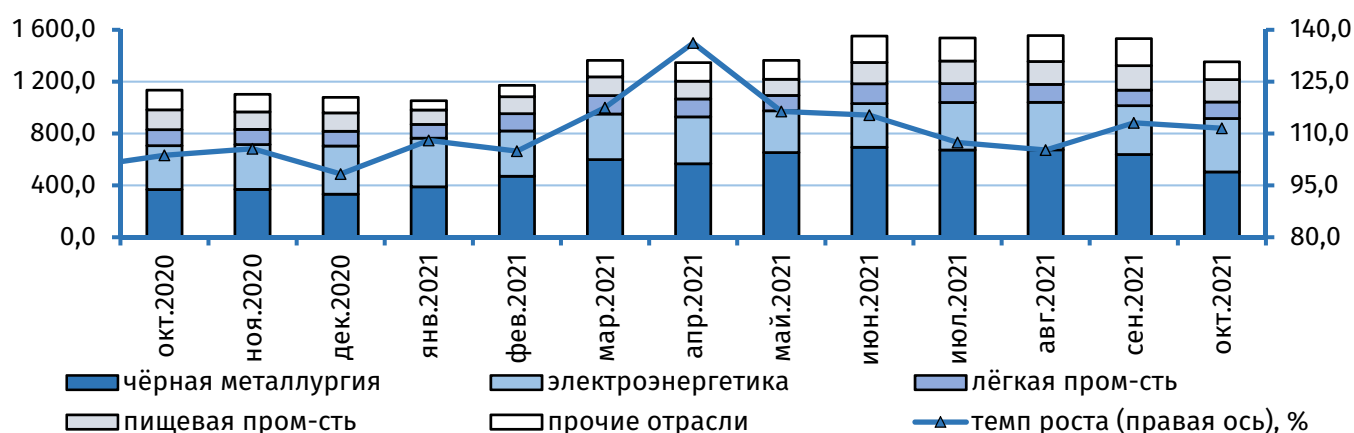
Рис. 1. Динамика промышленного производства в 2020-2021 гг., млн руб.

Результаты октябрьского опроса руководителей крупных промышленных предприятий свидетельствовали о сохранении индекса деловой активности на уровне значительно ниже стабилизационного, хотя с некоторым ростом к предыдущему месяцу (на 0,6 п., до 43,4%). При этом на фоне улучшения прогнозов относительно производственных параметров в предстоящем месяце индекс промышленного оптимизма возрос до 6,7%, превысив сентябрьское значение на 2,8 п.п.